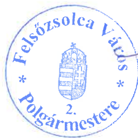
Szarka Tamás polgármester