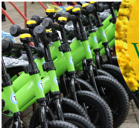
A kicsik legnagyobb öröme négyven darab Futóbiciklivel gazdagodott a Felsőszolcai Napközi Otthonos Óvoda.