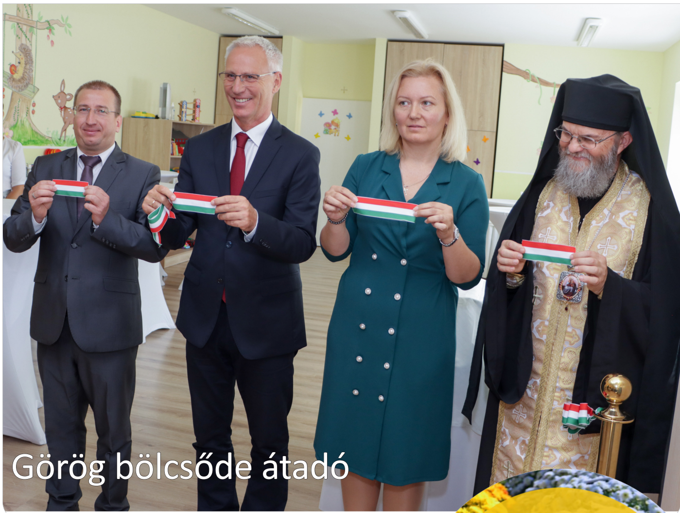
Görög bölcsőde átadó