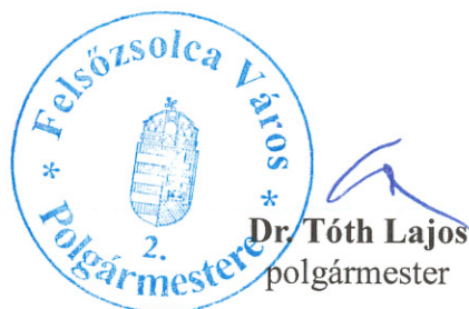
Dr. Tóth Lajos polgármester