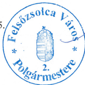
[Signature] Szarka Tamás polgármester