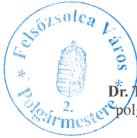
Dr. Tóth Lajos polgármester