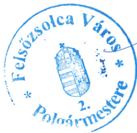
Szarka Tamás polgármester