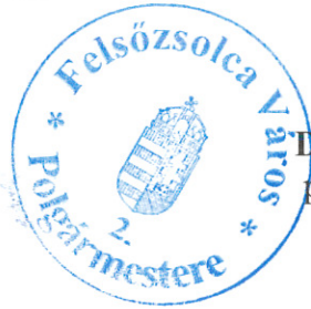
Dr. Tóth Lajos polgármester